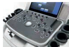
Panel de control integrado y diseño antipolvo