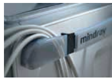
Organización de cables de transductor, diseñado para ordenar y proteger los cables