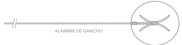
ALAMBRE DE GANCHO